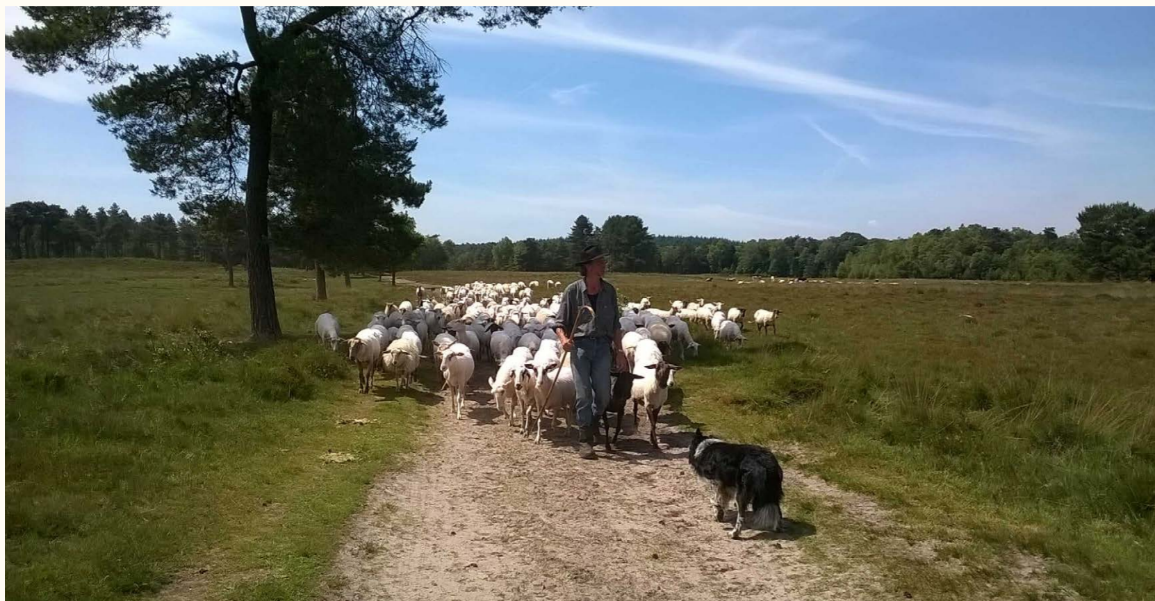
Gescheperde schaapskudde - het begrazen van gebieden door schapen betekent een weloverwogen beheer van het ecosysteem en geeft lokale identiteit

De Omgevingswet geeft in veel gevallen ruimte voor maatwerk. Van groot belang is dat dit maatwerk wordt geleverd in samenspraak met de inwoners. Immaterieel erfgoedgemeenschappen zijn actieve gemeenschappen die zich inzetten voor hun erfgoed. Het bij de ontwikkeling van de omgevingsvisie en het omgevingsplan participatief betrekken, is daarom een belangrijk uitgangspunt.