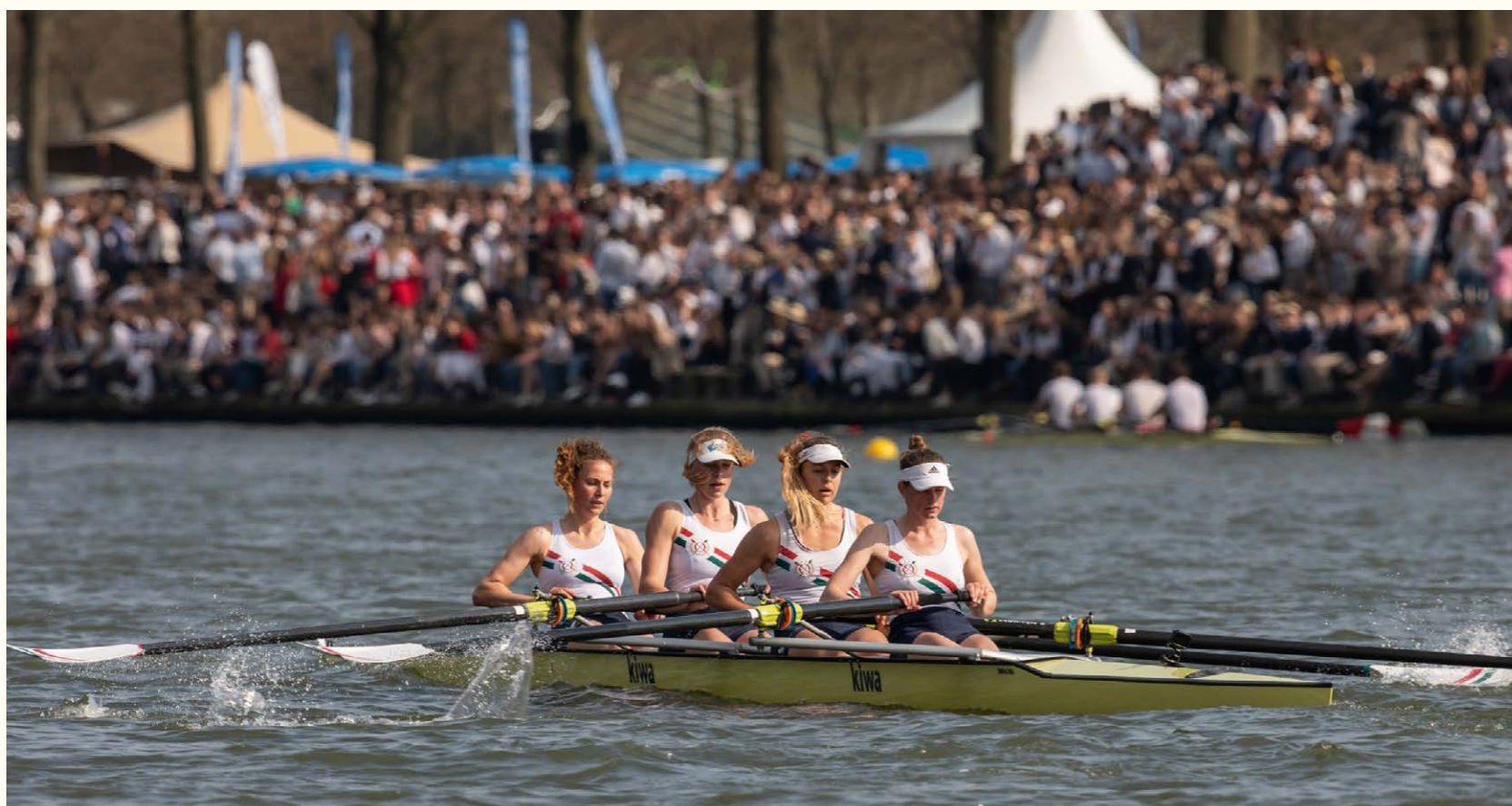
De uit 1878 stammende Varsity studentenroeiwedstrijden op het Amsterdam-Rijnkanaal trekken jaarlijks zo'n duizend roeiers en duizenden bezoekers. De organisatie werkt nauw samen met de gemeente Houten.

Ook kun je in het omgevingsplan bijvoorbeeld de 'biotoop' van een beschermde historische windmolen borgen, zodat de molen voldoende wind blijft vangen. Indirect draagt dit bij aan het behoud van de molen – die immers kan blijven draaien – en daarmee ook aan de uitoefening van het molenaarsambacht. Hetzelfde geldt voor watermolens, maar dan door de watertoevoer en -afvoer te borgen.