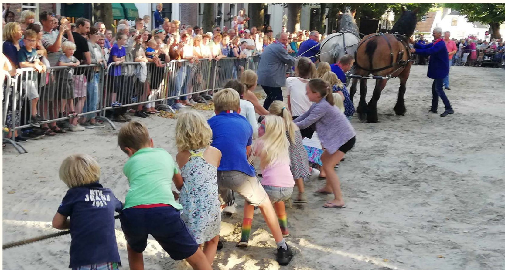
Kinderen in actie op de Voorschotense Paardendagen

Het omgevingsplan geeft bindende regels voor de fysieke leefomgeving en kan door het gemeentebestuur doorlopend gewijzigd worden. Uiteraard moet de wijziging van het omgevingsplan wel in (een zekere) overeenstemming zijn met het beleid uit de omgevingsvisie.