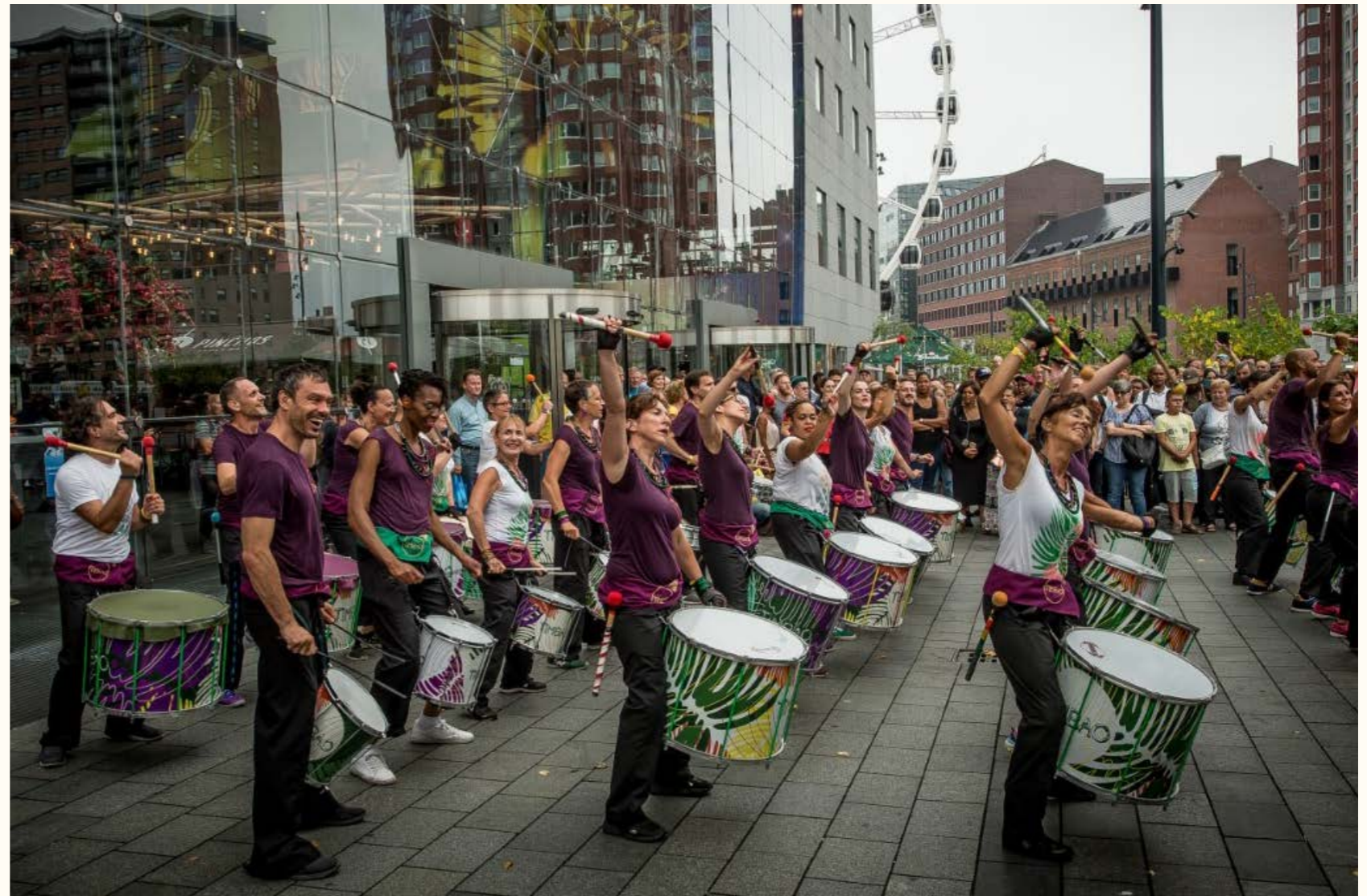
Het Zomercarnaval in Rotterdam verbindt inwoners met heel verschillende achtergronden

Immaterieel erfgoed is allereerst van belang voor de 'erfgoedgemeenschap', de mensen die het erfgoed beoefenen en er een gevoel van identiteit en continuïteit aan ontleen. Ook is het van belang voor mensen