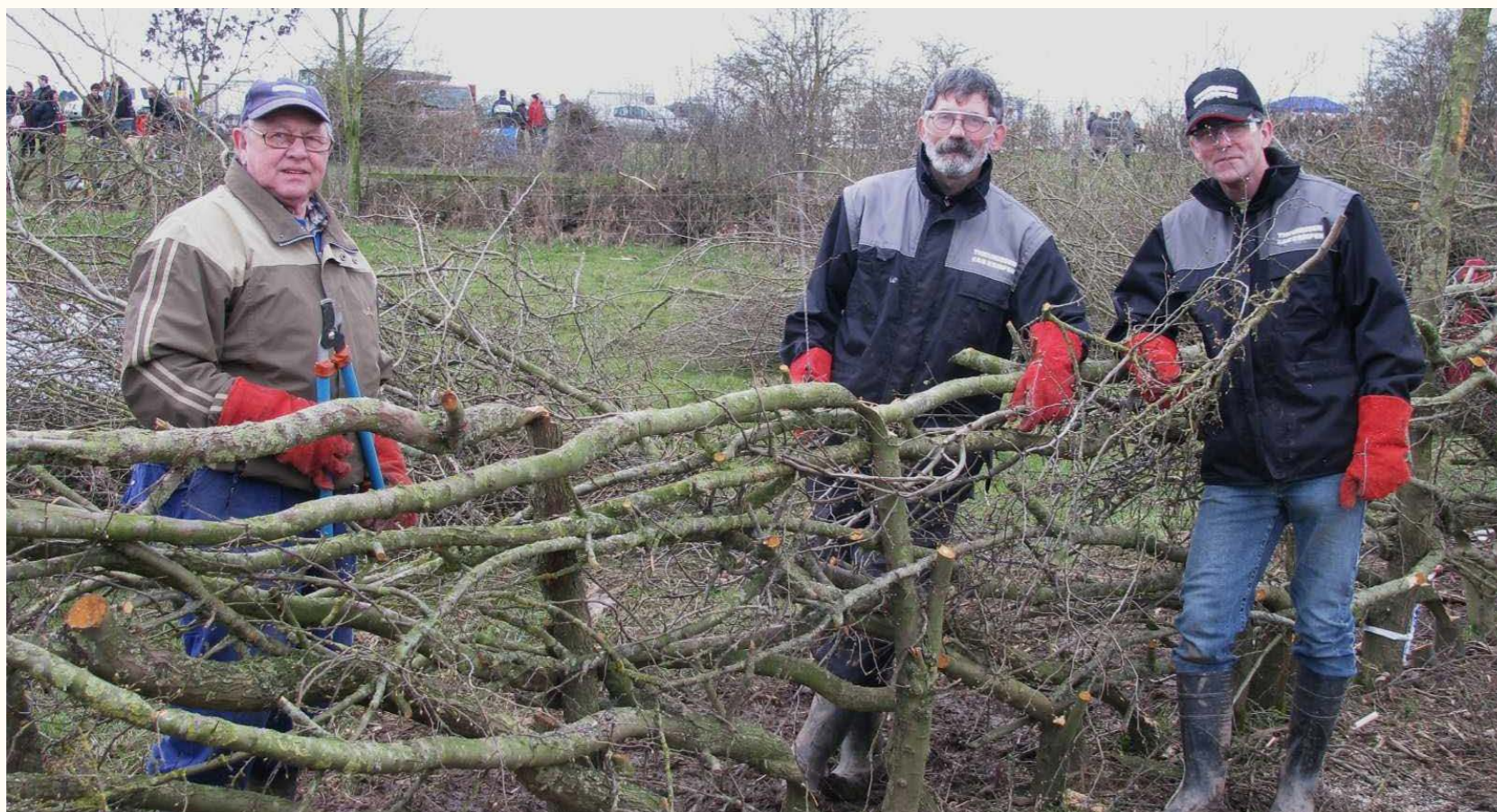
Heggenvlechten draagt bij aan duurzaam beheer van het landschap

Immaterieel erfgoed kan bijdragen aan duurzaamheidsdoelstellingen, bijvoorbeeld doordat traditionele ambachtsslieden op duurzame wijze produceren of door duurzaam natuurbeheer. Bovendien wordt er steeds meer gedaan om minder duurzame vormen van immaterieel erfgoed duurzamer te maken.