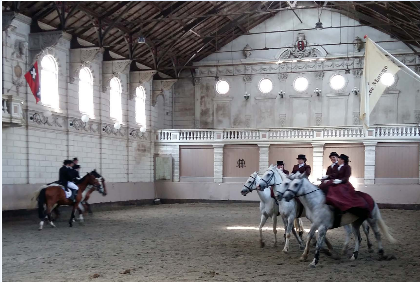
Rijden in dameszadel in de Vondelcarrousel in Amsterdam vindt plaats in een rijksmonument

Heb je vragen over immaterieel erfgoed en de Omgevingswet? Neem contact op met het Kenniscentrum Immaterieel Erfgoed Nederland: info@immaterieelerfgoed.nl .