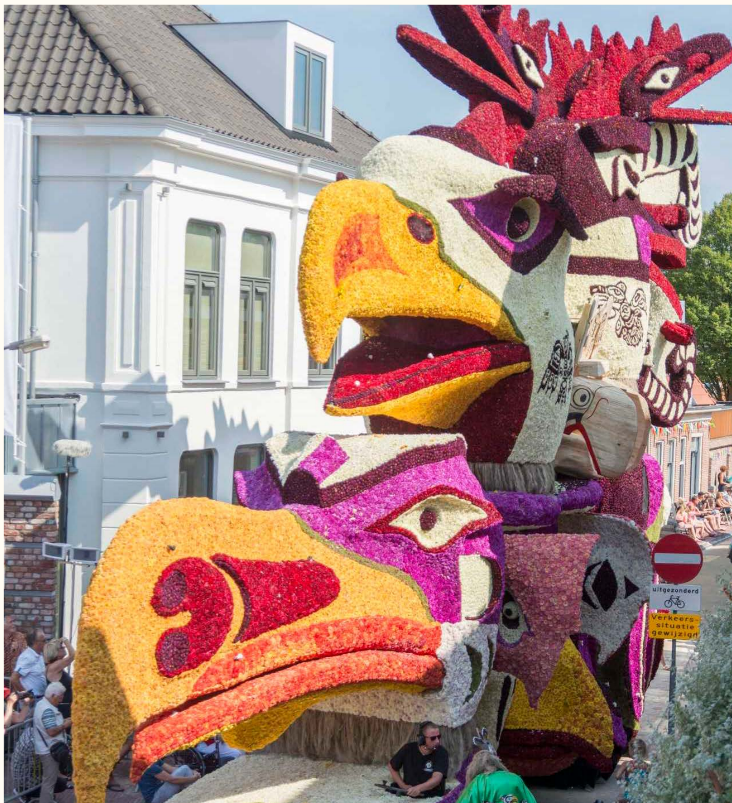
Het Bloemencorso in Vollenhove gaat door de nauwe straten van het centrum